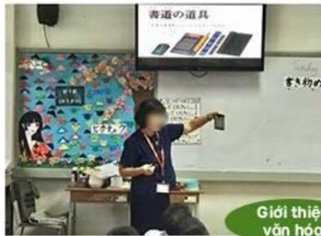
(Hình ảnh về dạy phối hợp giữa NP và giáo viên không phải bản ngữ)