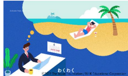
(2) Ví dụ đa dạng, phong phú