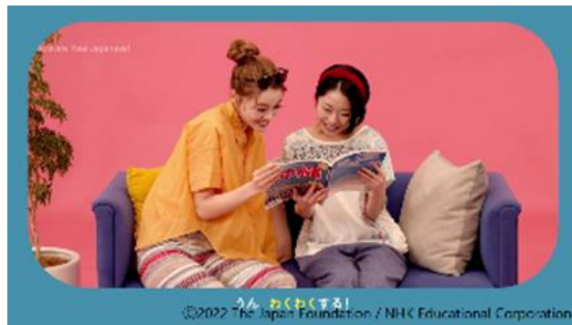
(3) Phân hội thoại mẫu

Các phần trong chuyên mục “Những từ láy truyền đạt cảm xúc”