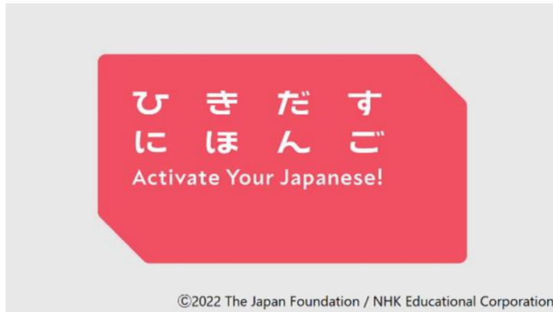
Tiêu đề chương trình “Mở khóa năng lực tiếng Nhật”