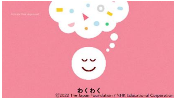
(1) Hình ảnh minh họa