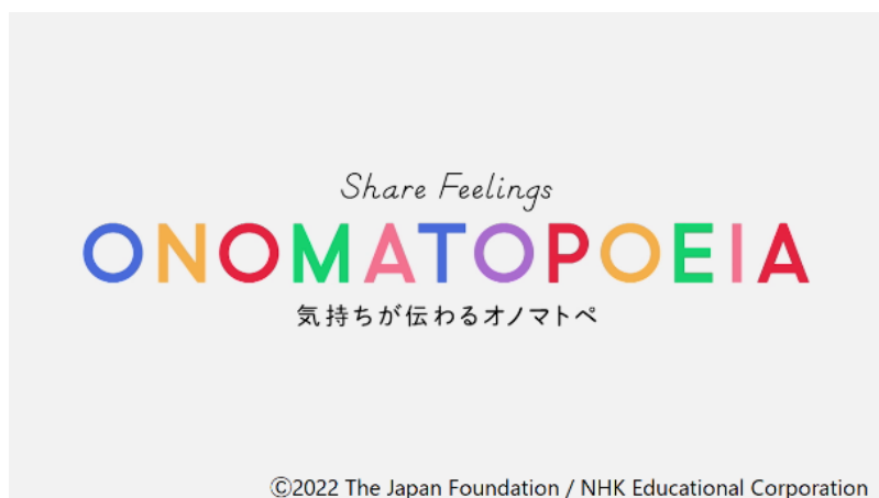
Tiêu đề chuyên mục “Những từ láy truyền đạt cảm xúc”

“Những từ láy truyền đạt cảm xúc” là chuyên mục gắn với mỗi tập giới thiệu một từ tượng thanh hoặc từ tượng hình trong độ dài khoảng một phút. Chuyên mục gồm các phần: phần hoạt hình minh hoạt về ý nghĩa hay hình ảnh của từ láy (xem ảnh (1) và (2) phía dưới) và phần hội thoại mẫu (3) có nội dung chân thực giới thiệu về cách sử dụng từ láy đó trong các ngữ cảnh giao tiếp thực tế.